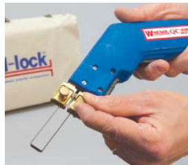
ブレード・付属品の 取付・取外しが簡単