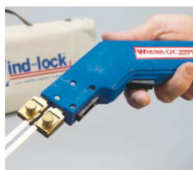
引き金式の電源入切スイッチ

静岡県掛川市青葉台1-7 Tel : (0537)23-3992 Fax : (0537)23-3993 e-mail : info@eifsjapan.com Web : www.eifsjapan.com