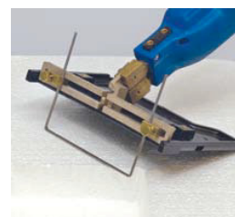
幅15cmで深さ 最大22cmまで

ホットナイフは、フォームプラスチックのための切断専用工具です。切断したり、形を成形したり、いろいろなことに使用できます。また、あらゆるカットが出来るようにブレードや備品も揃っており温度も調整できます。もちろん、ハンドルも加熱することはありません。