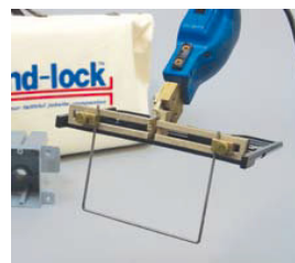
最大15cm幅まで 切断可能